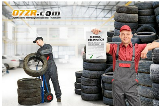
La plateforme 07ZR assure le recyclage des pneus dans

07ZR fournit à ses clients un service "recyclage pneumatiques" pour s'assurer que 100% des pneus VL et PL vendus sur sa plateforme sont recyclés et éliminés. En effet, un réparateur qui achète des pneumatiques par l'intermédiaire de plateformes digitales et de distributeurs pour les revendre à ses clients est considéré sur le marché français comme "producteur". Il est donc "importateur" de ces pneumatiques s'il s'agit de pneus achetés avec une facturation étrangère. A ce titre, il est tenu de respecter certaines obligations et notamment de déclarer auprès de l'Ademe la quantité de ces pneumatiques mis sur le marché. Il doit également s'affilier à un éco-organisme (F.R.P ou Aliapur) et s'acquitter d'une éco-contribution correspondante car non intégrée dans le prix d'achat du pneu. Pour simplifier les choses, 07ZR a mis en place un service recyclage sur-mesure pour accompagner ses clients dans leurs démarches afin qu'ils soient en parfaite conformité avec la législation environnementale. 07ZR apporte ainsi la garantie que l'ensemble des achats de pneumatiques des professionnels effectués via la plateforme 07ZR, quel que soit le fournisseur ou le pays de provenance, bénéficient de l'éco-contribution ainsi que d'une solution de collecte et de recyclage.